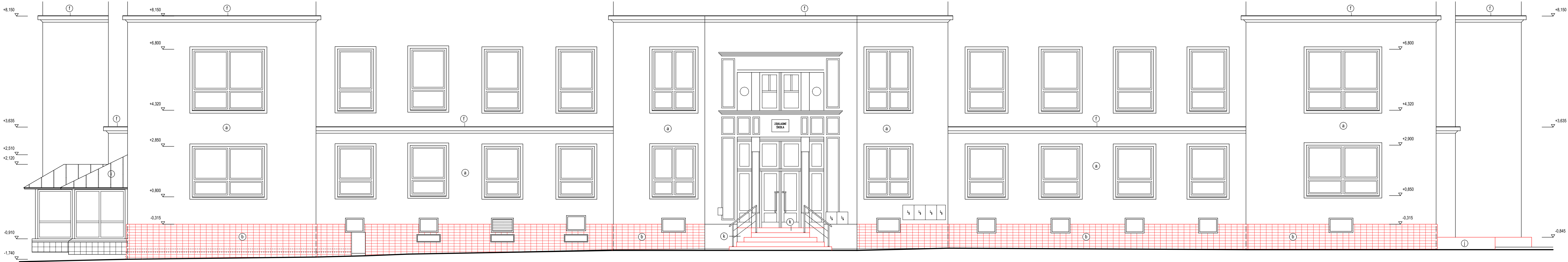
POHLED BOČNÍ - VSTUP ŠATNY